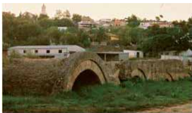
Restos del Puente Romano

Aznalcázar tuvo una gran importancia, como muestra la necrópolis romana de Los Navarros, en donde se hallaron abundantes piezas de la época, vidrios, lápidas y monedas acuñadas en la propia población.