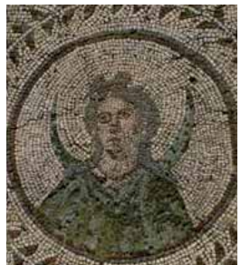
Mosaico del Planetario: Selene

En Itálica se construyeron casas magníficas de importantes familias patricias del imperio, que organizaron un conjunto residencial