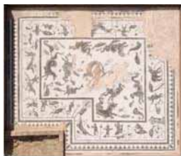
Mosaico de las Casa de Neptuno

Ocupa una manzana de gran tamaño que ha sido sólo parcialmente excavada. Contiene también unas Termas y otras habitaciones decoradas con bellos mosaicos.