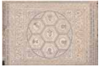
Casa del Planetario: Planta de la casa y detalle del mosaico