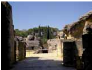
Foso de servicio para los diferentes espectáculos de gladiadores