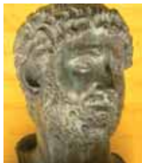
Busto de Publio Aelio Adriano

En Itálica nació Marco Ulpio Trajano (53-117), primer emperador oriundo de una provincia romana. Su sucesor, Publio Aelio Adriano (76-138), fue educado parcialmente en Itálica, ciudad a la que honró el título de Colonia Aelia Augusta Itálica y la creación de un nuevo barrio (Nova Urbs). Fue entonces cuan-