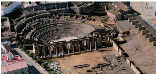
Vista aérea del Teatro Romano

En el siglo XVII, cuando la villa de Santiponce se trasladó a las colinas donde se hallaba la vieja Itálica, el Teatro queda oculto bajo un viejo caserío.