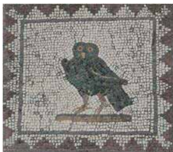
Mosaico de la Casa de los Pájaros

Sus muros han sido levantados recientemente en un intento de recrear los espacios que configuraban la vivienda. Ésta se organiza en torno a un peristilo o jardín porticado.