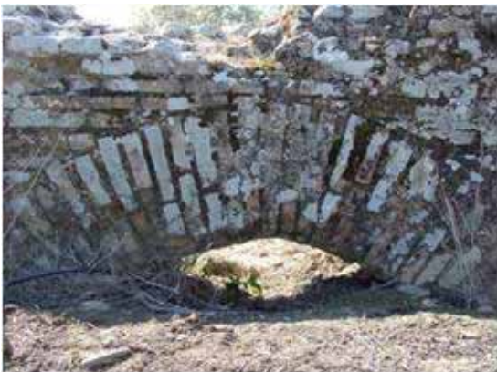
Conducciones en arco, a nivel y subterráneo del acueducto