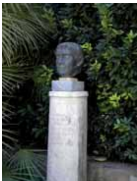
Busto de Trajano, a la entrada de Itálica

Así, en Itálica se distinguen dos zonas: la vetus urbs (ciudad vieja), originaria ciudad fundada por Escipión, y la nova urbs (ciudad nueva), fundada por Adriano, y en actividad desde el primer tercio del siglo II hasta mediados del siglo III. El resto de la ciudad pervivió hasta la dominación musulmana.