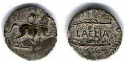
Moneda acuñada en LAELIA

LAELIA, tiene sus orígenes en la época de los turdetanos y en época romana y llegó a acuñar su propia moneda, de las que se conocen ocho series de monedas o medallas, la mayor parte de ellas con bustos de emperadores y atributos agrícolas, Las monedas de Laelia poseían en su reverso espigas de trigo o palmas ■