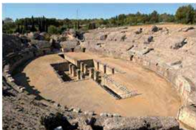
Vista del Anfiteatro

Es de los mayores del Imperio romano, con capacidad para veinticinco mil espectadores. El graderío (cavea) estaba formado por tres niveles de gradas (ima, media, y summa cavea), de las que sólo