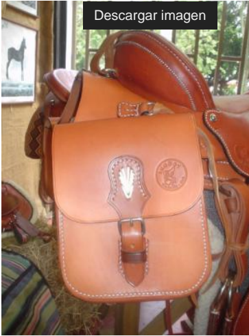
Guarniciones y marroquinería