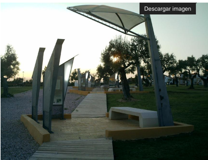
Vista del recorrido y de los carteles explicativos

El sentido del itinerario se ha orientado según nos marca el dolmen, en dirección sureste-noroeste, en el sentido de acceso al mismo desde el corredor a la cámara funeraria.