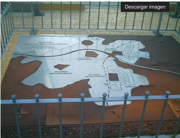
Localización de los Dólmenes de Valencina y Castilleja

Edad de Cobre. Al final del recorrido se puede contemplar la restitución de un pequeño dolmen, aproximándonos a las características constructivas de los mismos.